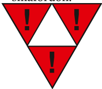
Figur 2. Varningsetikett nr 15

Innan skjutsning sker i riktning mot ett fordon eller en fordonsgrupp enligt uppräknningen ovan ska den som beslutar om igångsättning se till att två bromsskor eller en bromssläde är utlagda på ett sådant avstånd att det inte kan uppstå några stötar.